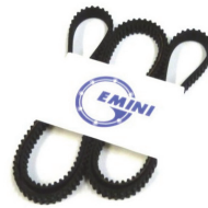
8767-BLT ドライブベルト 5,900円