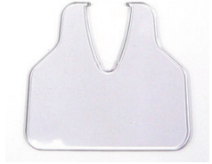
8767-EYE-S アイシールド 1,500円