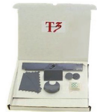
8767-AKT:4,500円 アクセサリキット 円・直線