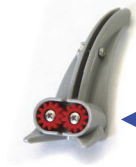
8767-SFOOT スタビライザーフット 4,500円