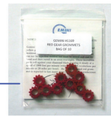
8767-RGB 替えギア 10個 4,200円