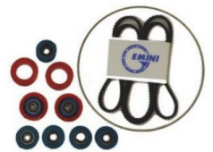
8767-C-MKT コンプリート メンテナンスキット 34,000円