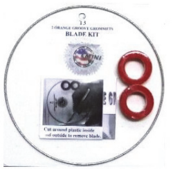
8767-SSLC:7,500円 スーパースライサー →