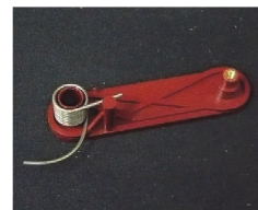
8767-TSPG テンションパーツ 3,500円