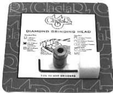
Types Of Grinding Heads