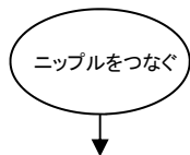
ニップルをつなぐ

パイプ全体に外ネジが切られた全ネジタイプ。 電縫鋼管・平行ネジ 1.2t 内径φ7、1/8inch