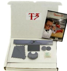
直線や円形 加工に