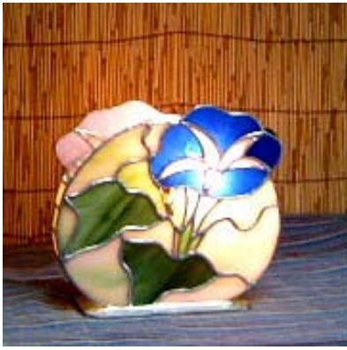
「あさがおランプ」 状態