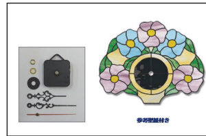
B:お試ミルフィオリ C:ガラスパターン冬号 D:型紙付時計ムーブメント