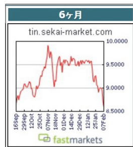
スズ相場半年前相場にまで下げ